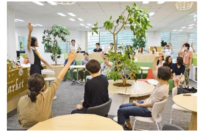
▲以前の SMN オフィス開催の様子 (2017 年 9 月初開催時)