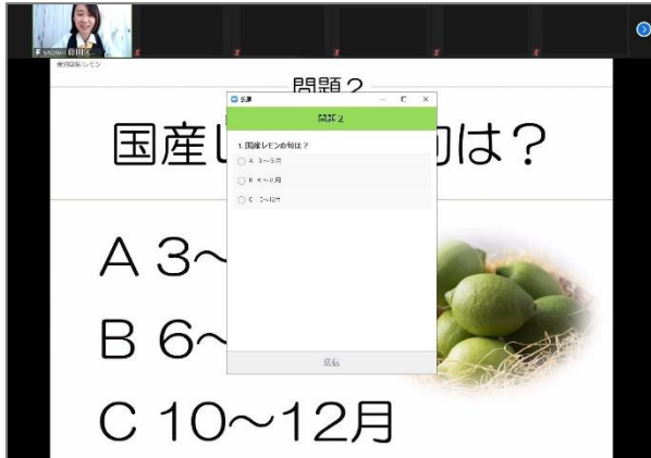
▲11 月 18 日にウェビナーで行われた実際の画面